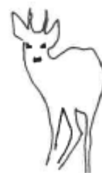
ADULTE ou VIEUX : discret, méfiant.