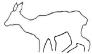
DÉFICIENT ou MALADE