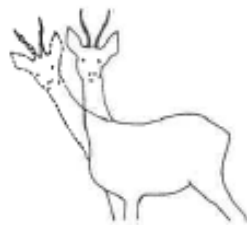
JEUNE : curieux, très mobile.